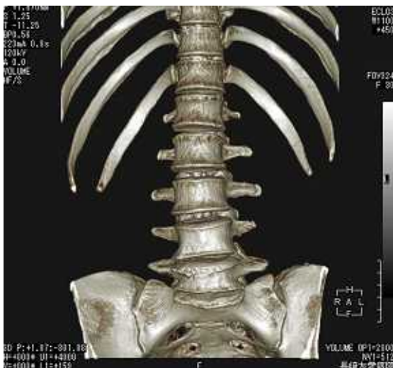
腰椎 - 3D

撮影した輪切りの画像から、任意の角度の断面像や3次元表示画像を作ることができます